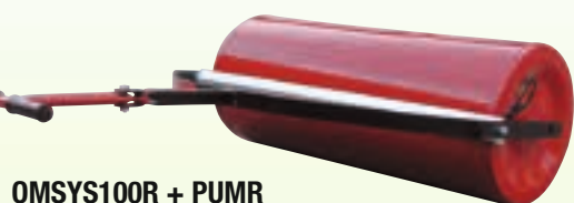
OMSYS100R + PUMR