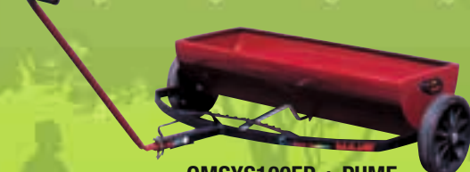
OMSYS100EP + PUME